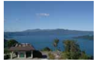
十和田八幡平 国立公園