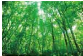
世界自然遺産 白神山地