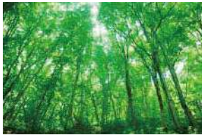
世界自然遺産 白神山地