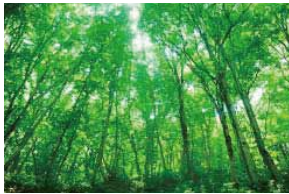
世界自然遺産 白神山地